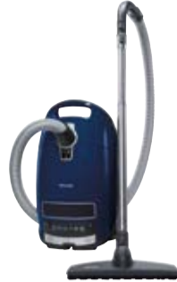
Complete C3 Parquet