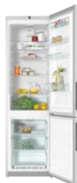
Chłodziarka - zamrażarka KFN 29132 D edt/cs