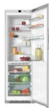
Chłodziarka KS 28463 D cs