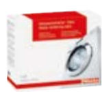
Tabletki zmiękczące wodę do pralek

Tabletki zmiękczące wodę do zastosowania w pralkach Miele polecane przy twardości wody przekraczającej 14°dH.