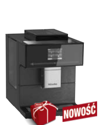
Ekspres do kawy CM 7750 CoffeeSelect**