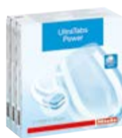
Tabletki do zmywarek

Zestaw kapsulek do prania tkanin wymagających specjalnej pielęgnacji: 3 x WoolCare, 2 x SilkCare, 2 x Puch oraz 3 x Booster.