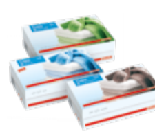
CAPS AQUA/ NATU-RE/ COCOON

Zestaw kapsulek przeznaczony do usuwania uporczywych plam – jako dodatek do prania.