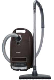
Complete C3 TotalCare