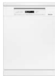
Zmywarka G 6000 SC