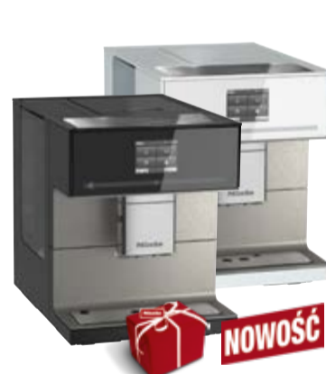
Ekspres do kawy CM 7500*/CM 7550**