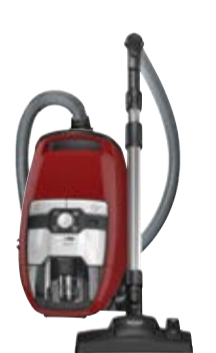
Blizzard CX1 Red EcoLine