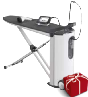
FashionMaster B 3847