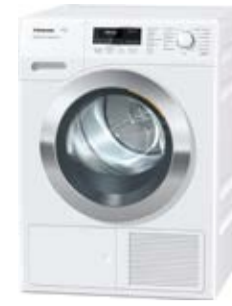
Suszarka TKR 850 WP ChromeEdition