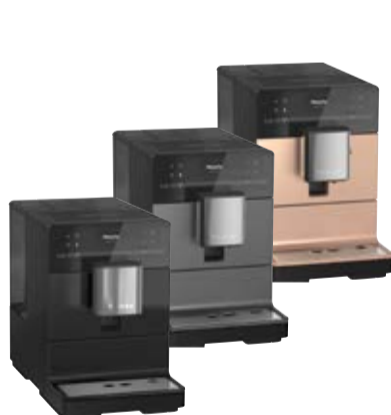
Ekspres do kawy CM 5300/5500