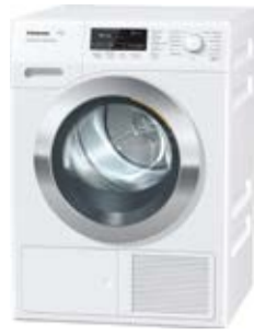
Suszarka TKG 850 WP ChromeEdition