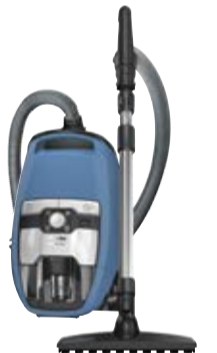
Blizzard CX1 Parquet PowerLine