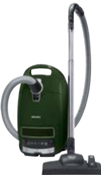
Complete C3 Green EcoLine**