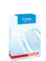
Sól do zmywarek

Proszek do zmywarek zapewnia doskonałe rezultaty mycia, chroni oraz pielęgnuje naczynia i szkło.