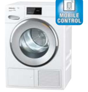
Suszarka TMV 843 WP WhiteEdition - linia Prestige