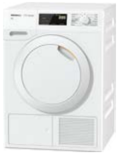
Suszarka TDB 230 WP Active