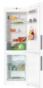
Chłodziarka - zamrażarka KFN 28132 D ws