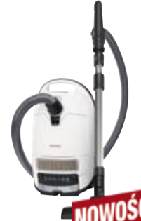
Complete C3 Allergy**