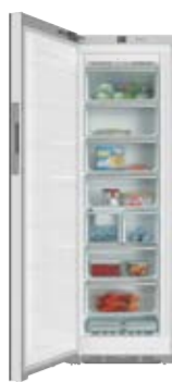
Zamrażarka FNS 28463 E