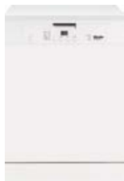
Zmywarka Active G 4203