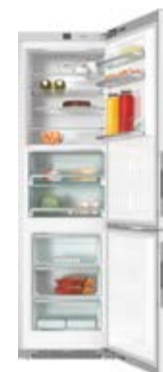
Chłodziarka - zamrażarka KFN 29683 D brws