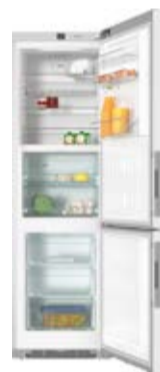
Chłodziarka - zamrażarka KFN 29283 D bb