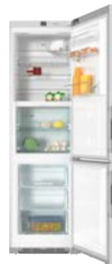
Chłodziarka - zamrażarka KFN 29283 D edt/cs