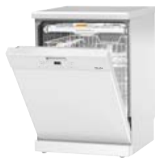
Zmywarka G 4930 SC