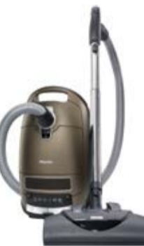
Complete C3 Electro EcoLine