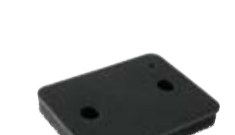
Filtr do suszarek

Listwa łącząca pralkę i suszarkę w kolumnie z szufladą.