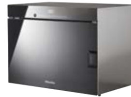
Urządzenie do gotowania na parze DG 6010