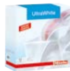
UltraWhite – proszek do prania białych tkanin

Zestaw kapsulek do prania wełny i tkanin delikatnych.