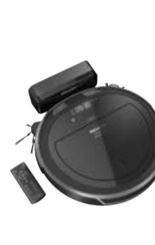
Scout RX2 HomeVision