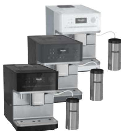
Ekspres do kawy CM 6350