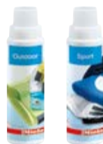
Outdoor, Sport – płyny do prania odzieży membranowej oraz sportowej

Płyn do impregnacji odzieży zabezpiecza włókna, dzięki czemu stają się odporne na wodę i kurz. Materiał zachowuje przy tym elastyczność oraz właściwości oddychające, przeciwdeszczowe. • ok. 4 cykle prania