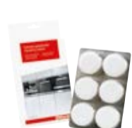
Tabletki do odkamieniania

Przeznaczone do regularnego czyszczenia zaparzacza w ekspresach ciśnieniowych Miele.