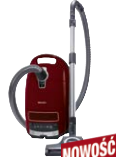
Complete C3 Cat&Dog**