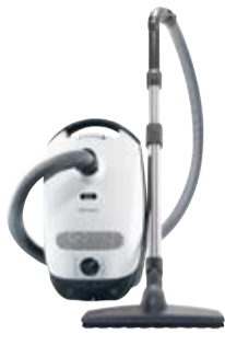
Classic C1 Parquet