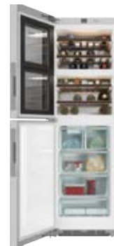
Winiarko-zamrażarka KWNS 28462 E ed/cs