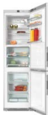
Chłodziarka - zamrażarka KFN 29683 D obsw