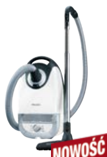
Complete C2 Jubilee PowerLine