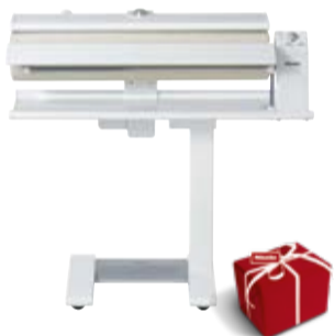
Prasownica B 995 D