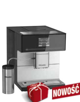
Ekspres do kawy CM 7300*/CM 7350**