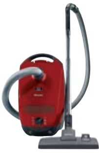
Classic C1 PowerLine