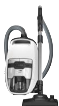
Blizzard CX1 Comfort EcoLine