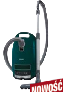
Complete C3 Jubilee PowerLine