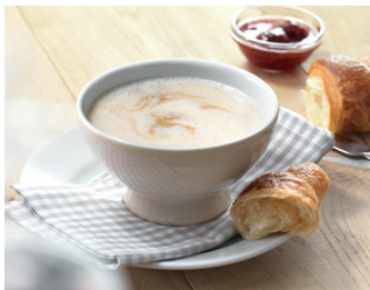
Café au lait