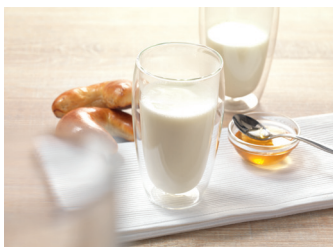
Gorące mleko/pianka z mleka