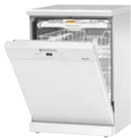
Zmywarka G 4930 SC