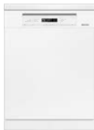
Zmywarka G 6000 SC Jubilee