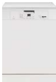
Zmywarka G 4203 Active